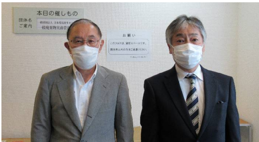
【(左) 藤波講師・(右) 相木副理事長】