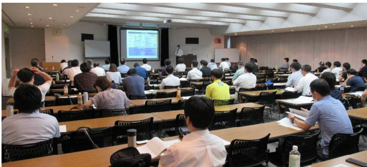
【 講習会風景 】