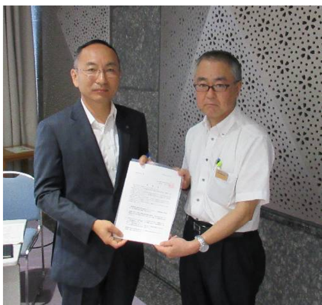
理事長より県知事あて要望書を県資源循環推進課長へ手交

令和元年8月26日(月)午前9時45分より愛知県三の丸庁舎8階大会議室において、愛知県環境局主催の「下水道の整備等に伴う一般廃棄物処理業等の合理化事業関係及び一般廃棄物関係担当課長会議」が開催されました。