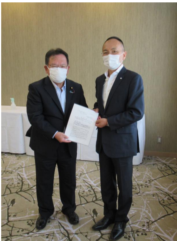
【愛知県連副会長 酒井参議院議員へ要望書を手交】